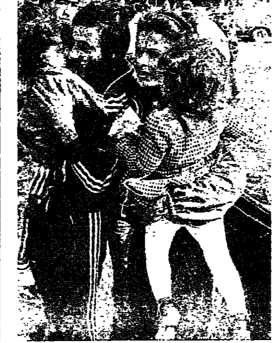
لقاء المعتقلين مع توبهم